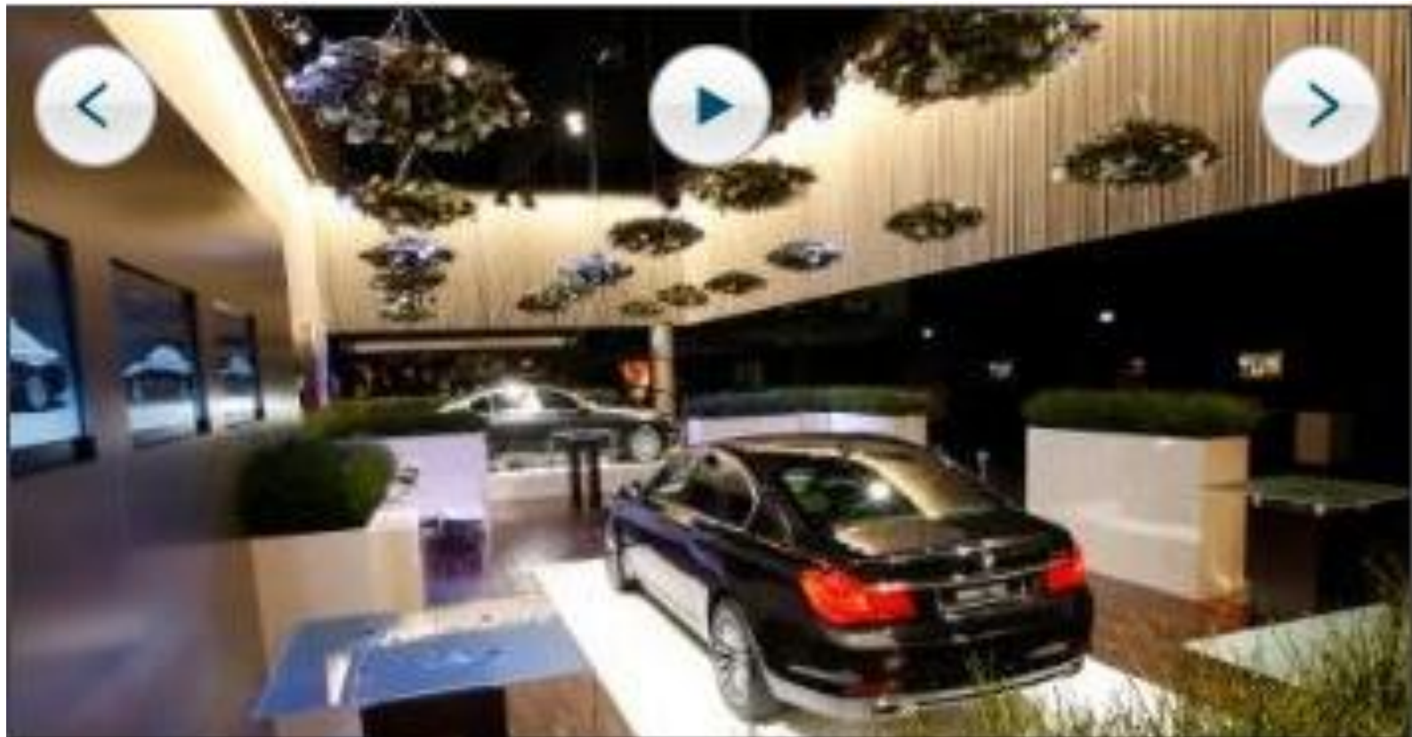
Het plafond boven de stand werd gesierd door tientallen organische vormen, ingevlochten met bijzondere, witte bloemen.