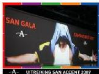
UITREIKING SAN ACCENT 2007

Het evenementenbureau Adriaanse/van Kuyk Brand Events heeft samen met UbachsWisburn/JWT op donderdag 22 mei een SAN Accent ontvangen voor de gezamenlijke BMW campagne EfficientDynamics in de categorie "Duurzaam".